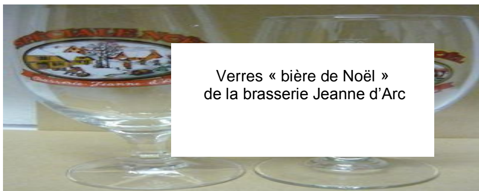
Verres « bière de Noël » de la brasserie Jeanne d'Arc